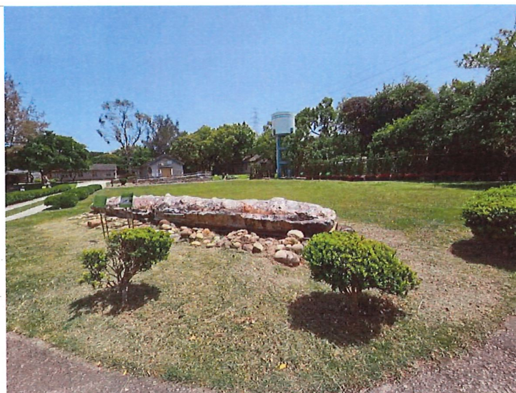
考古遺址代表 圖像