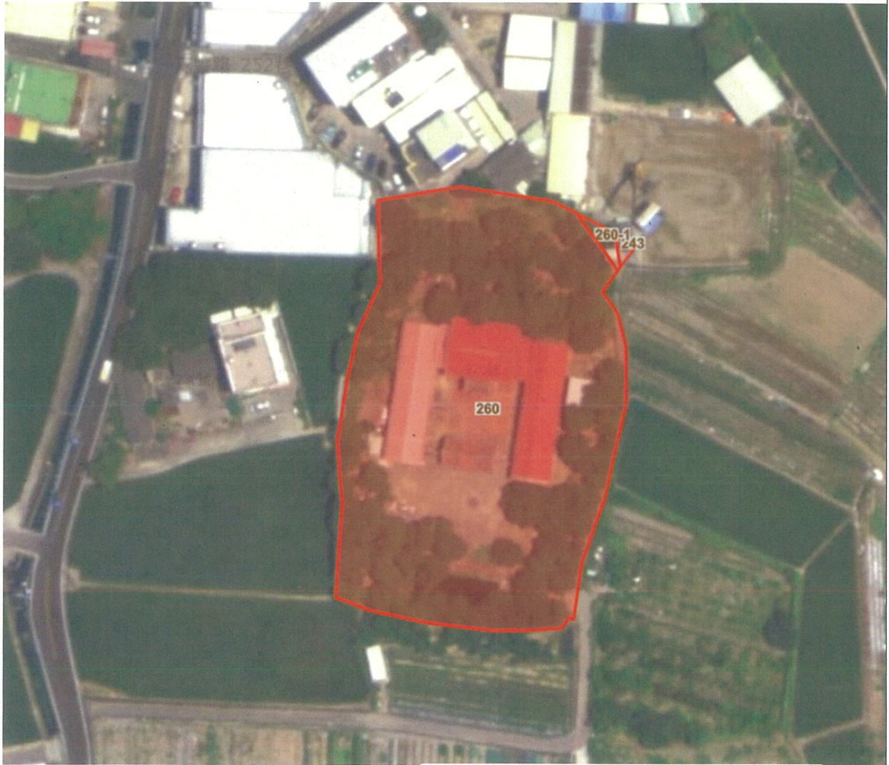
潭子區嘉仁段 243、260、260-1 地號