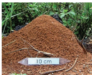
入侵紅火蟻成熟蟻巢

明顯隆起的蟻丘是最容易辨別入侵紅火蟻的方法，因為台灣約 270 種螞蟻中，沒有會築出高於地面 10 公分蟻丘的種類，蟻丘內部呈蜂巢狀結構，但需注意蟻巢初形成時並無明顯之蟻丘，易與其它種類螞蟻之蟻巢混淆。