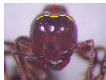
入侵紅火蟻後頭部平順無凹陷