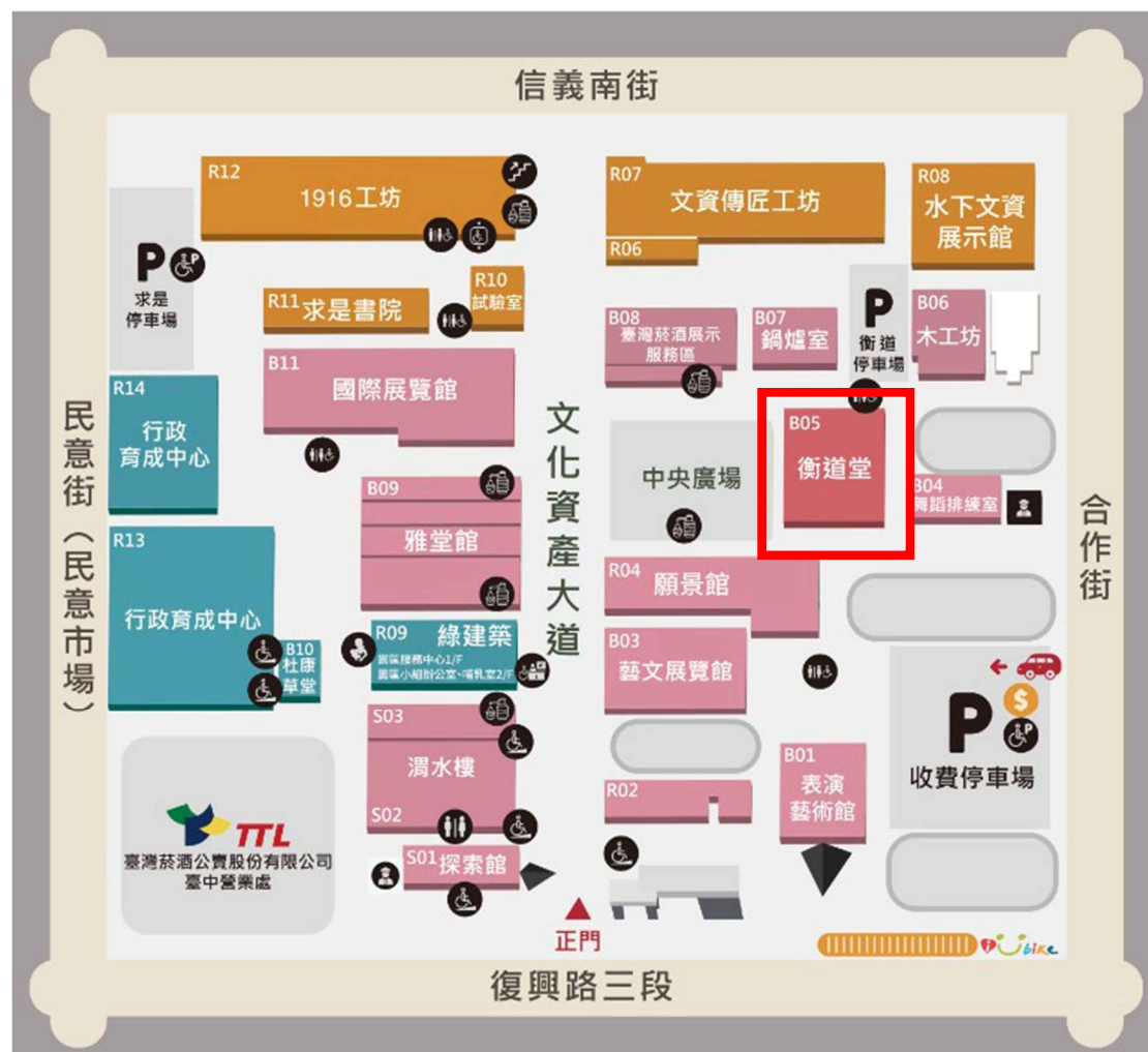
文化部文化資產園區地圖