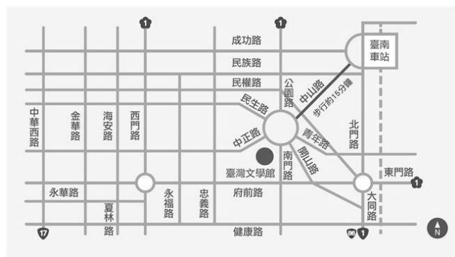
▲ 文化部文化資產局 文化資產保存研究中心