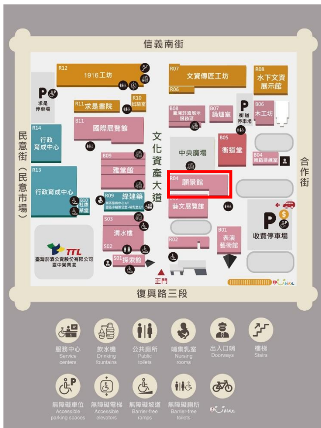
▲文化部文化資產園區導覽平面圖(紅框處:願景館)