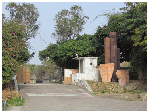
【圖 1-4】牛罵頭文化園區現況照片