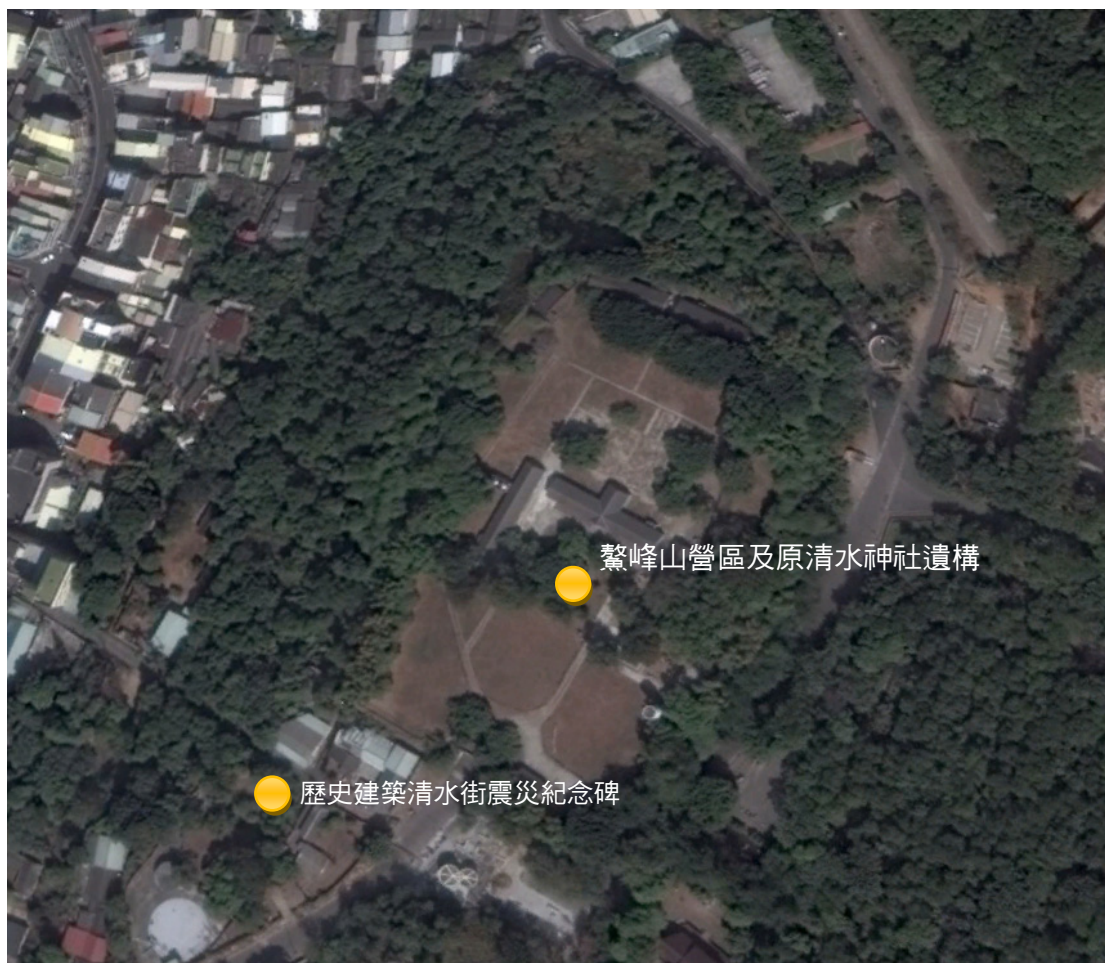
【圖 1-1】計畫區各文化資產位置圖

本計畫區可略分為三個時期歷史沿革。1.牛罵頭遺址所在除了具有豐富的史前文化堆積之外，同時為清代牛罵頭社領域，鄰近即為漢人早期移民清水地區的象徵性寺廟紫雲巖與聚落所在；2.日治時期日人在遺址上建立神社，今日猶存部分遺跡，可視部分包括日治時期圍牆、大門旁崗哨及臺灣神社守護神獸狛犬(高麗犬)一對；及 3.戰後中央政府時期營舍建築。這些歷史推移從四千多年前迄今形成長遠的歷史流程，可以說是完全反映臺灣中部地區人類活動歷程。