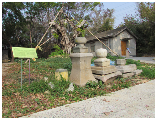
【圖 1-5】神社遺構現況照片