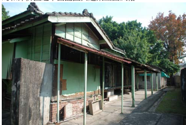
【圖 0-3】典獄官舍和館後側外觀