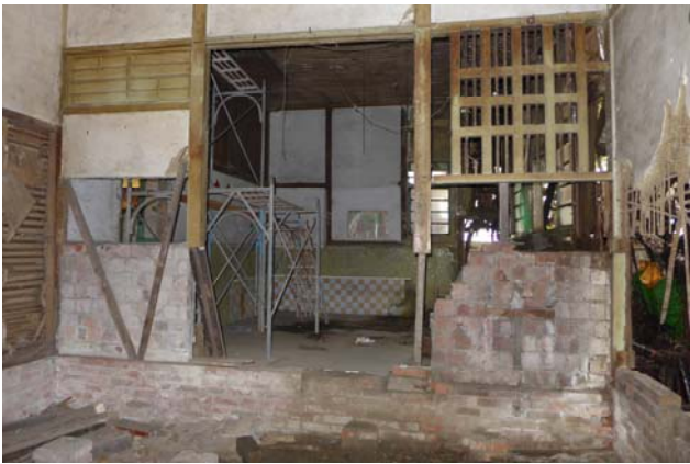
【圖 0-27】女脫衣間的日式木作床架已拆除