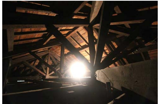
【圖 0-14】和館木屋架採用「真束小屋」形式