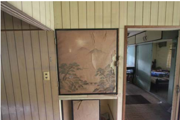
【圖 0-11】和館原有襖門，圖樣精緻