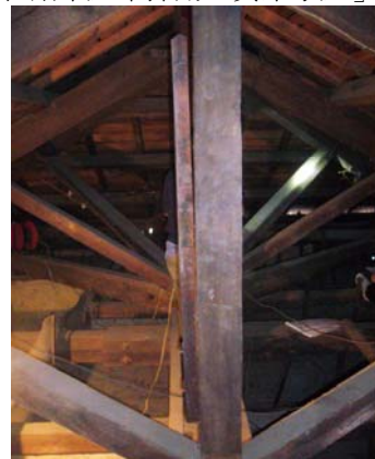
【圖 0-16】位於和館屋架真束上的棟札