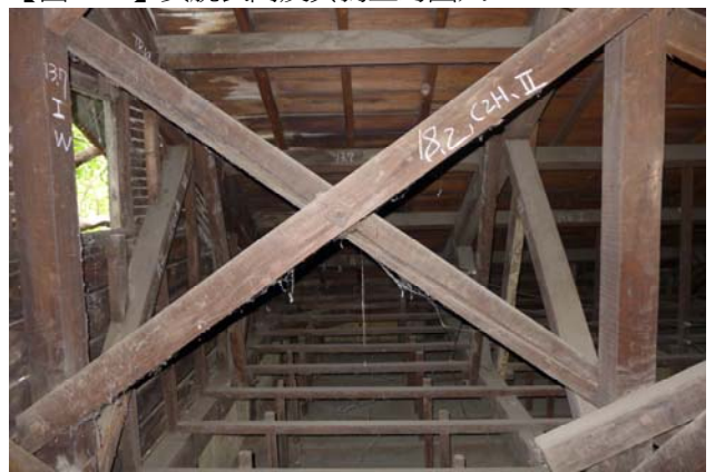
【圖 0-30】木屋架採用「真束小屋」形式