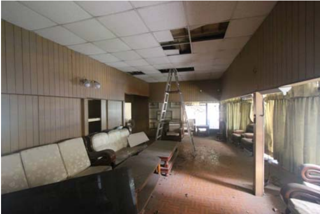
【圖 0-9】和館起居空間有許多後期的裝修