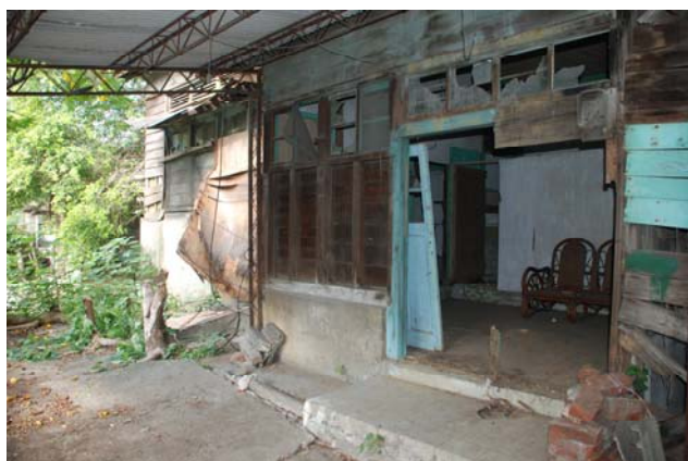
【圖 0-19】男脫衣間的入口