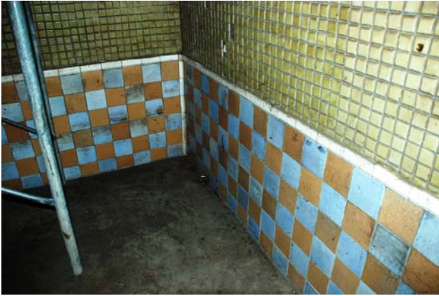
【圖 0-25】女浴間的大浴池壁面磁磚