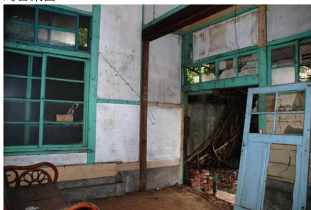
【圖 0-20】男脫衣間室內已變更