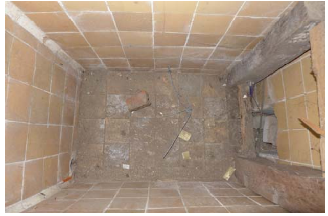
【圖 0-26】女浴間的小浴槽採用橘色磁磚