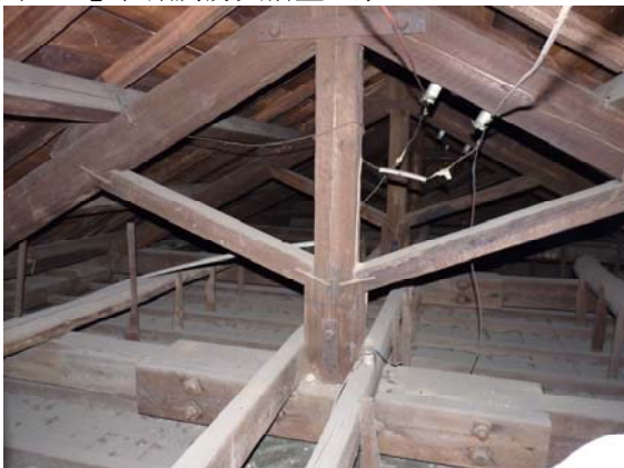
【圖 0-15】洋館木屋架採用「真束小屋」形式