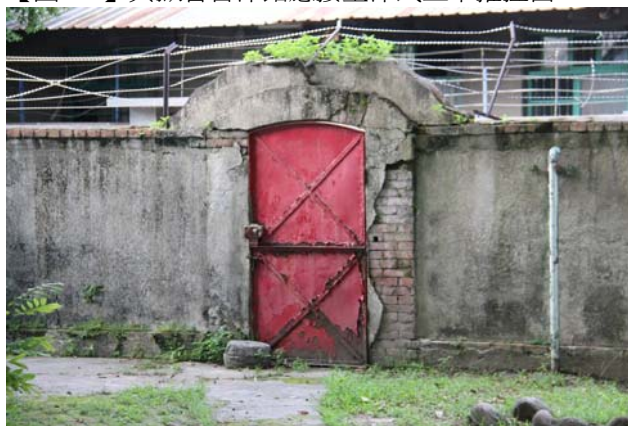
【圖 0-8】日治時期的圍牆側傭人門