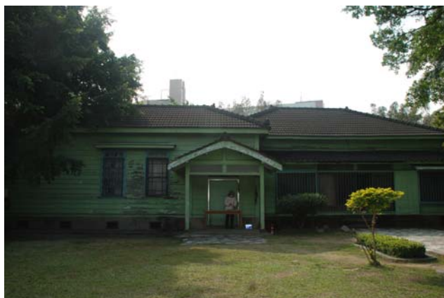
【圖 0-1】臺中刑務所典獄官舍外觀，為高等官舍常見的和洋併置之平面配置與建築立面風格。