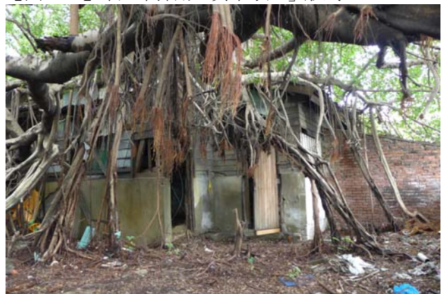
【圖 0-32】屋後的榕樹氣根與建物糾結，對結構造成很大侵害