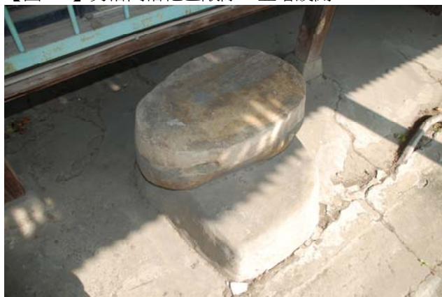
【圖 0-7】日治時期的和館起居空間的沓脫石