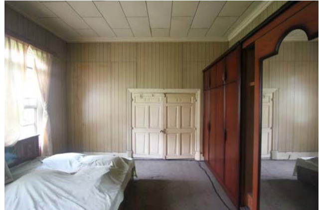
【圖 0-10】和館應接室一景，門窗為原貌，亦有後期裝修