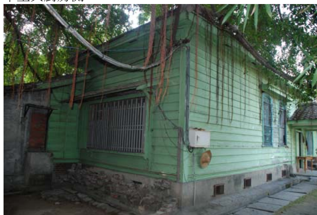
【圖 0-4】典獄官舍洋館接待空間外觀