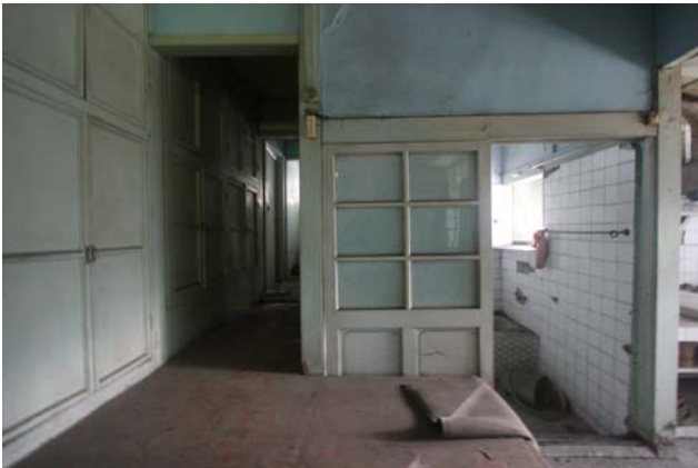
【圖 0-13】和館廚房與浴室一景