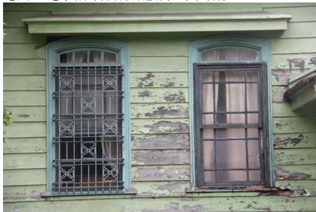
【圖 0-6】典獄官舍洋館應接室洋式上下推拉窗