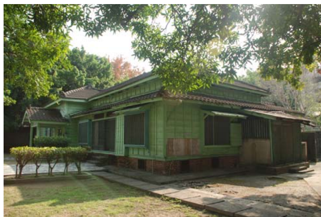
【圖 0-2】臺中刑務所典獄官舍和館起居空間外觀，女中室與廚房側。