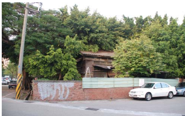
【圖 0-17】職員共同浴場外觀