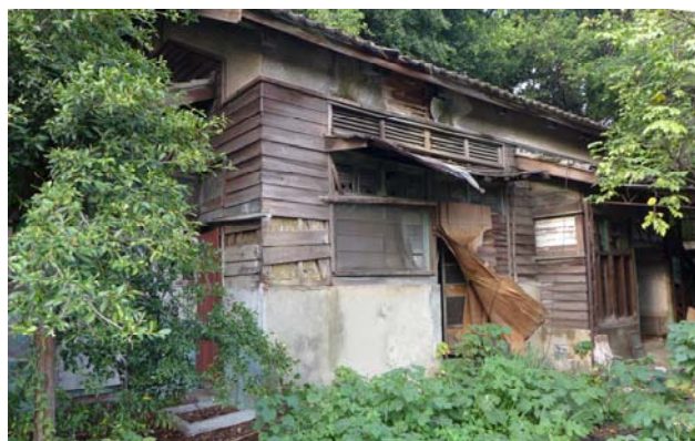
【圖 0-18】浴場為雨淋板磚木造建築，立面設有散熱的百葉窗