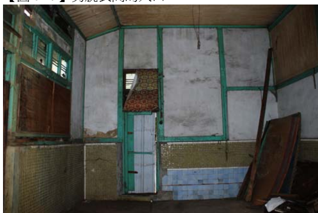
【圖 0-21】男浴間浴池已敲除，並增設開口