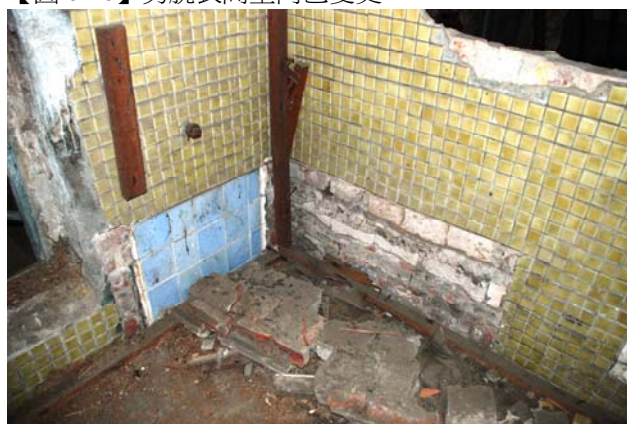
【圖 0-22】男浴間的小浴槽痕跡