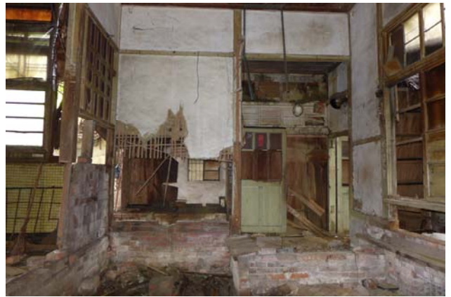
【圖 0-28】女脫衣間及其獨立的出入口