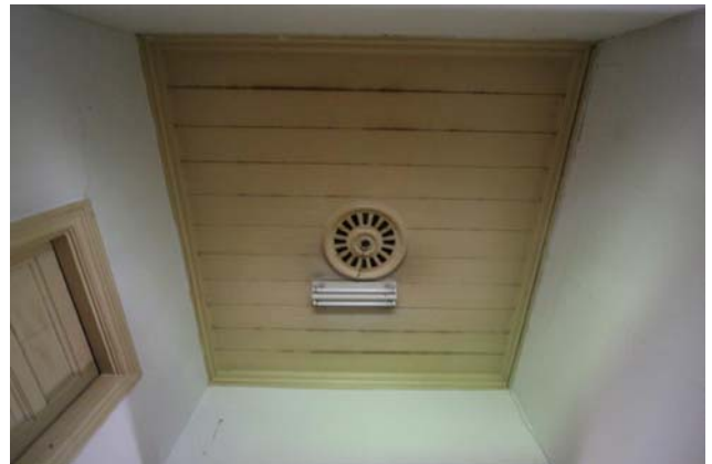
【圖 0-12】入口玄關洋式風格的天花板與燈座