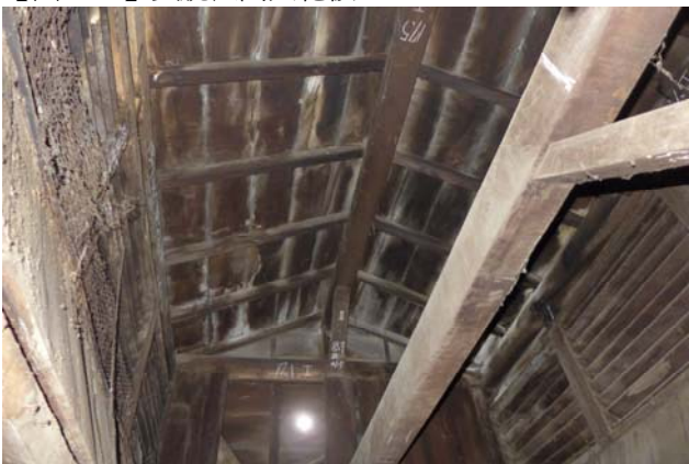
【圖 0-31】浴間上端有高起的太子樓作為散熱、通氣之用