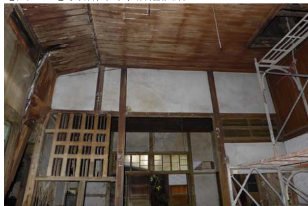
【圖 0-24】女浴間與女脫衣間之間的開口部未設門扇