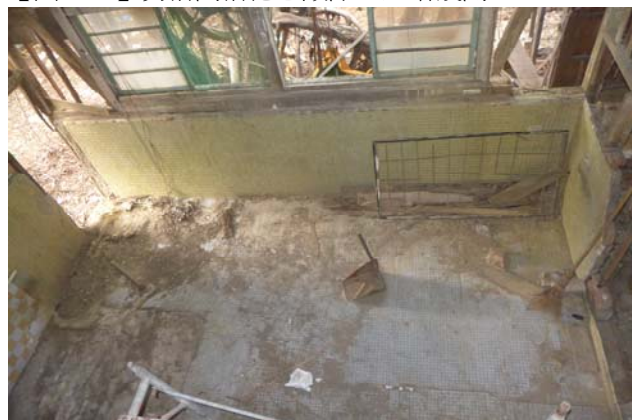
【圖 0-23】女浴間室內地坪因榕樹根系侵入而出現裂縫