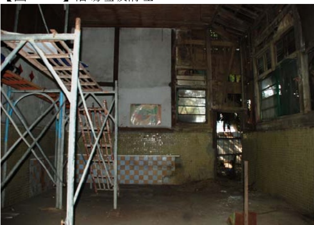
【圖 1-1-6】浴場室內清潔後鷹架搭設。