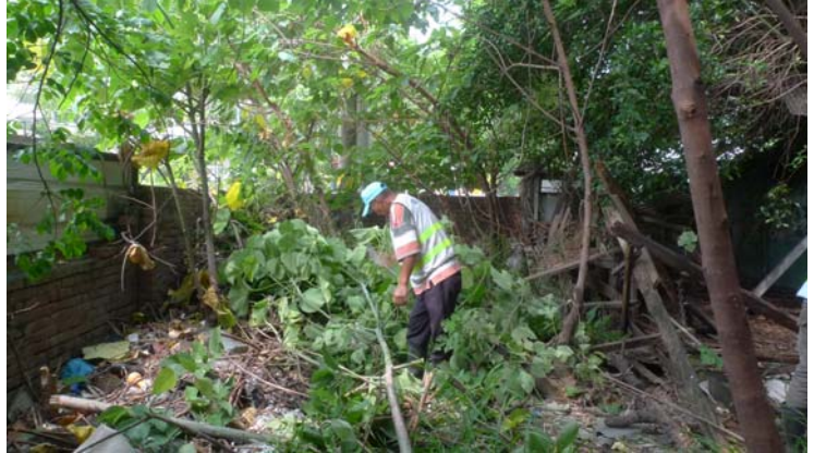
【圖 1-1-2】8月7日召開的浴場樹木可清理範圍之會議。 【圖 1-1-3】9月12日台中監獄協助構樹的砍除。

102年10月11日持續進行外部環境清潔，11月18日進行浴場內部環境清潔，以及搭設屋架測繪與調查之工作鷹架。