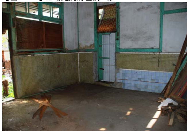
【圖 1-1-7】浴場室內清理後一景。