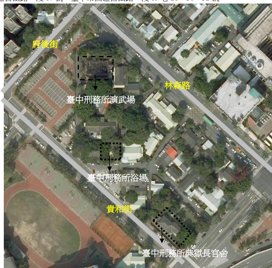
【圖 1-1-1】臺中刑務所典獄官舍與臺中刑務所浴場位置圖

古蹟名稱：臺中市市定古蹟「原台中刑務所典獄官舍」 土地所有權：中華民國 管理者：法務部矯正署臺中監獄 臺中市市定古蹟「原台中刑務所浴場」 土地所有權：中華民國 管理者：法務部矯正署臺中監獄 地址：臺中市西區自由路一段 87 號、臺中市西區自由路一段 89 巷 28、30、32 號