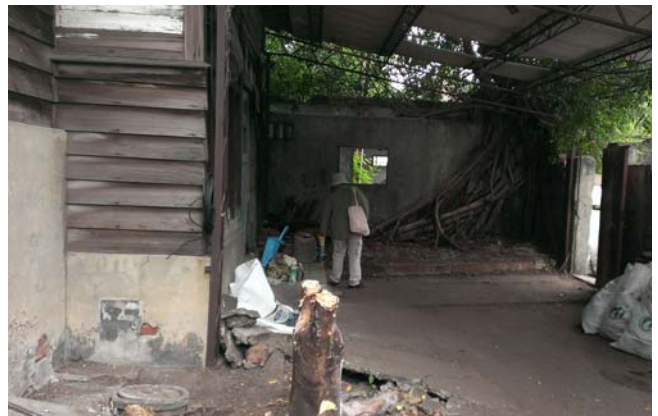
【圖 1-1-5】浴場庭院清理後一景。