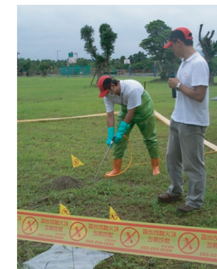
使用觸殺型藥劑灌注蟻丘