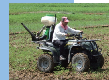
沙灘車搭載動力餌劑撒佈機

螞蟻接觸藥劑後死亡。使用灌注設備將稀釋的觸殺型藥劑注滿蟻巢；如為粒劑，則撒佈在蟻丘上及周圍，而後均勻灑水，使土壤水分達飽和狀態。