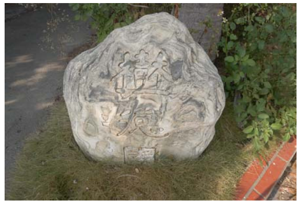
照片 8-2-2：呂佛庭題「樹德園」庭石（本研究攝）