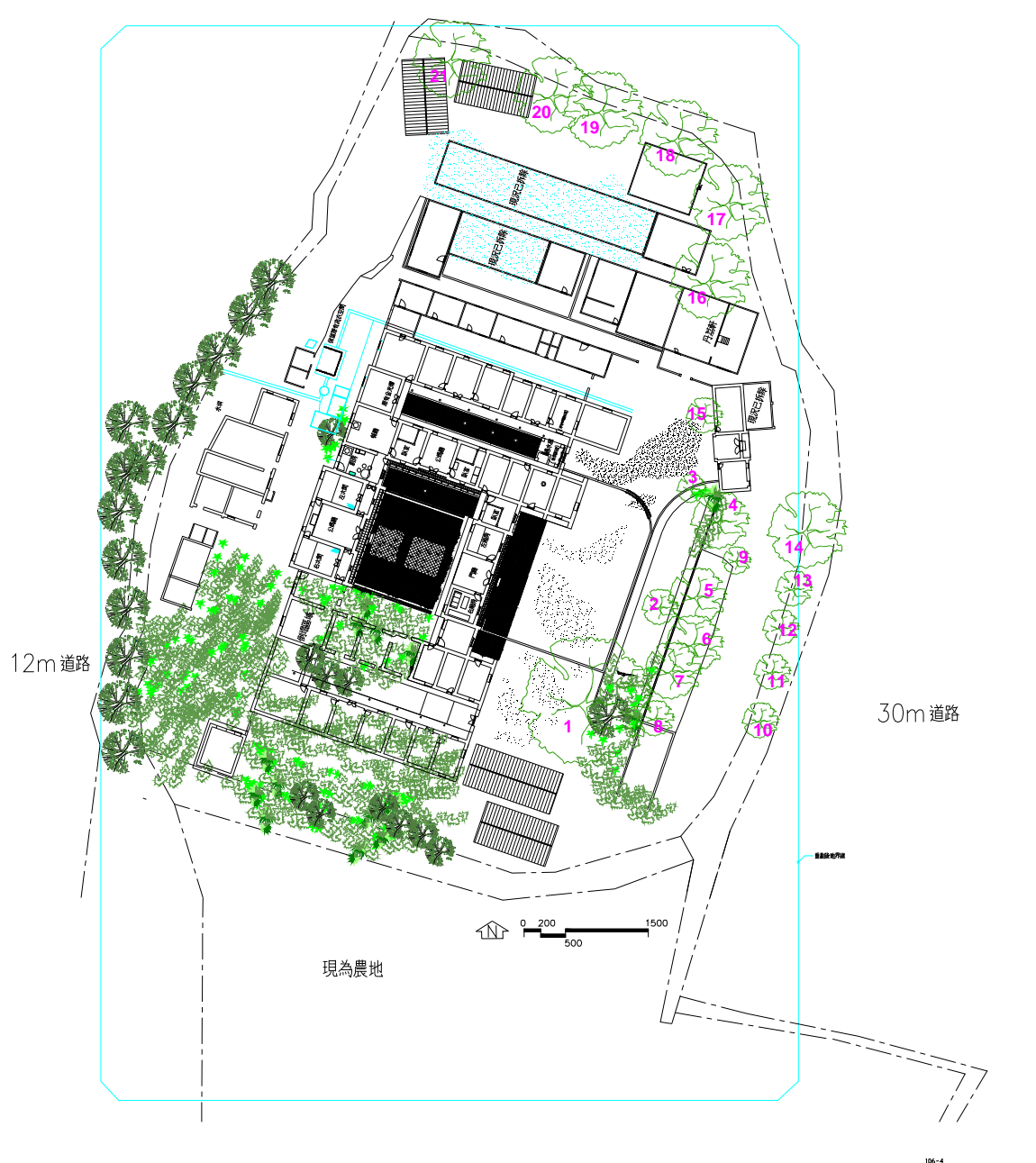
圖 8-2-1：重劃範圍內之全區建物現況圖（本研究繪製）