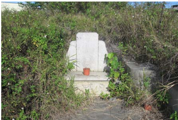
照片 8-2-1：位在頭家厝的林德行風水

本研究林家十七世德行公位在頭家厝之墓，見證林家發展歷程及四張犁頭家厝一帶的漢人開墾室機，建議提升其文化價值，並其定著土地登錄歷史建築（墓葬類）。另外在古厝左前方立有一庭石，刻有「樹德園」，題字人為書畫大師呂佛庭（原名呂天賜），但此石所立緣故不詳。