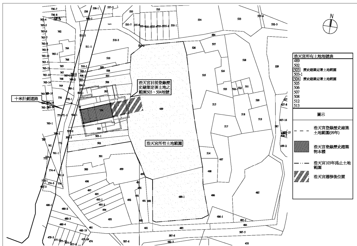
【圖 1-1-1】浩天宮地籍圖資