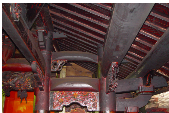
仍保持原有形貌的木構架