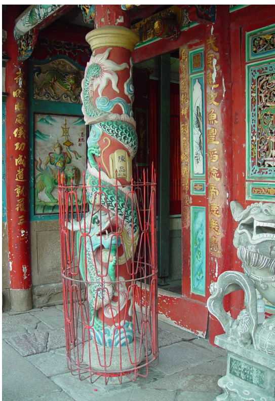
民國五十三年修建的龍柱