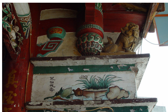
民國七十一年施作的彩繪