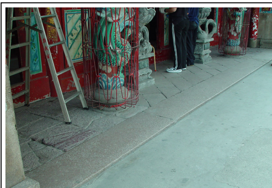
仍保持原有形貌的紅普石地坪