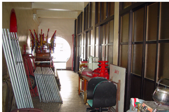
民國七十二年增建的辦公室