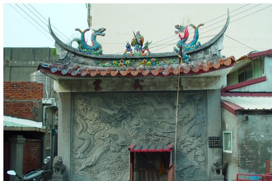
民國六十六年增建的照壁