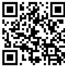
工作坊 google 報名表單